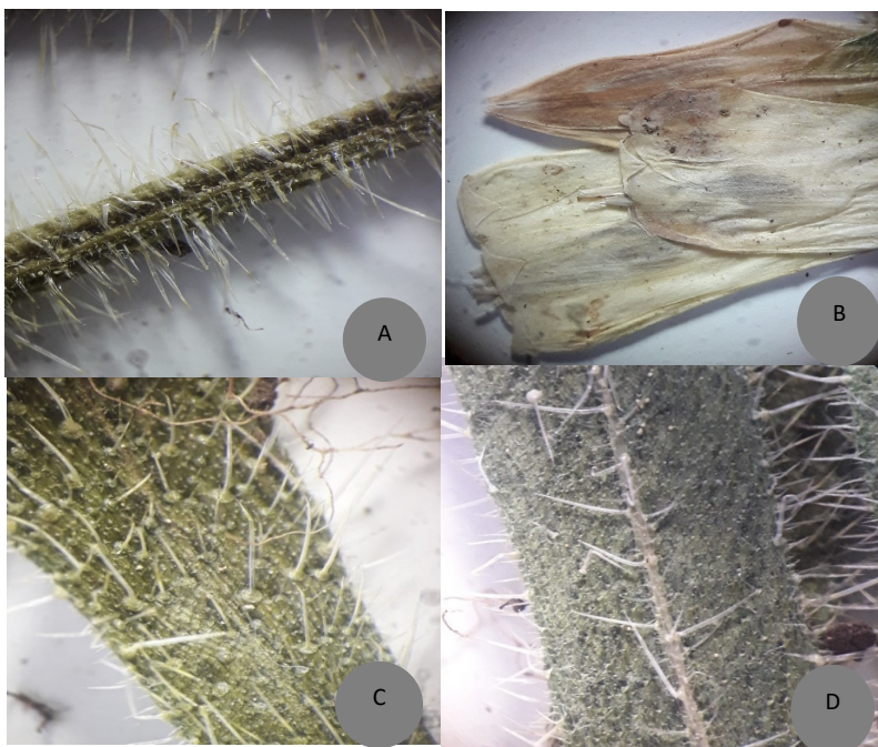
شکل ۴- استریو-میکروگراف پوشش کرک از O. nuristanica : A. ساقه، B. جام گل، C. سطح بالای برگ، D. سطح پایینی برگ (عکس از ع. سلطانی احمدزی).