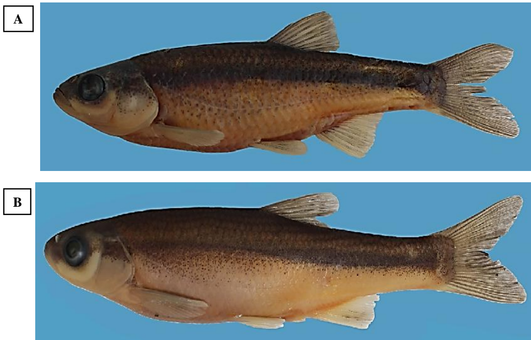
شکل ۱- نمای جانبی دو گونه P. ulanus (A) و A. atropatena (B) صید شده از رودخانه مهابادچای، حوضه دریاچه ارومیه. Figure 1. Lateral view of Petroleuciscus ulanus (A) and Alburnus atropatena (B) collected from the Mahabad-Chi River, Urmia Lake basin.