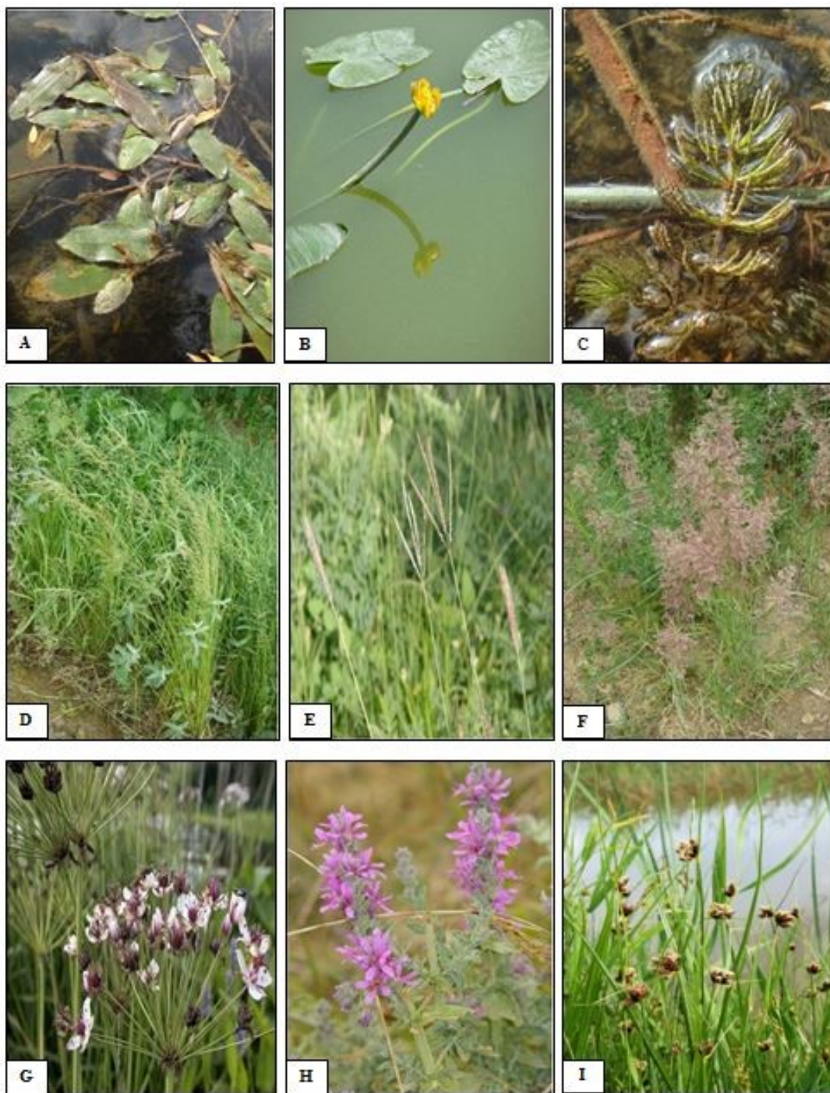
شکل ۳- تصاویر ۹ گونه گیاهی حاضر در رویشگاه‌های مورد بررسی.

Figure 3. Photographs of nine plant species in the studied habitats, A. Potamogeton nodosus . B. Nuphar lutea . C. Ceratophyllum demersum . D. Catabrosa aquatic . E. Bothriochloa ischaemum . F. Calamogasteris pseudo . G. Butomus umbellatus . H. Lythrum salicaria . I. Bolboschoenus maritimus .