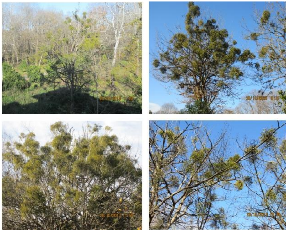
شکل ۱- نمونه‌هایی از درختان آلوده به دارواش با شدت‌های مختلف آلودگی.

به طور کلی، تحقیق حاضر به منظور کسب شواهدی مبنی بر تأثیر مخرب دارواش بر ثبات رشد و فعالیت فتوسنتزی گیاه انجیلی از طریق اندازه‌گیری برخی مشخصه‌هایی که اثبات‌کننده میزان تنش در یک گیاه هستند طراحی شده است.