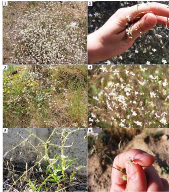
شکل ۳- (۱، ۲) Gypsophila polyclada var. polyclada . (۳، ۴) Gypsophila polyclada var. leioclada . (۵، ۶) Gypsophila pilosa var. pilosa .

Fig. 3. (1, 2) Gypsophila polyclada var. polyclada . (3, 4) Gypsophila polyclada var. leioclada . (5, 6) Gypsophila pilosa var. pilosa .