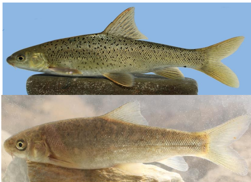
شکل ۱- نمایی جانبی از دو گونه سیاه‌ماهی، بالا: Paracapoeta trutta و پایین: Capoeta damascina رودخانه سیروان Fig 1. The lateral view of Paracapoeta trutta (upper) and Capoeta damascina (below) from Sirvan River