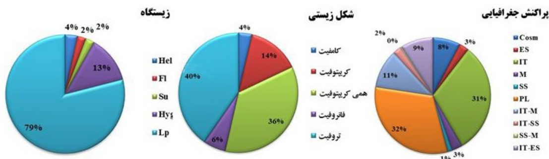
شکل ۲- نمودارهای وضعیت رویشی، شکل زیستی و پراکنش جغرافیایی گونه‌های گیاهی. Figure 2. Habitat, biological form and corology diagrams of plant species.

جدول ۲- فهرست گونه‌های گیاهی شناسایی شده در رویشگاه‌های آبی استان کرمانشاه. علائم اختصاری وضعیت رویشی: Hel= برآمده از آب، Hyd= آبی (Life form): Cha= کامفیت، Cr= کریبتوفیت، Fl= شناور، Su= غوطه‌ور، Hyg= رطوبت‌پسند، LP= Land plant= گیاهان خشکی؛ شکل‌های زیستی (Life form): Cha= کامفیت، Cr= کریبتوفیت، Hem= همی کریبتوفیت، Pha= فانروفیت، Thr= تروفیت، پراکنش جغرافیایی (Chorotype): Cosm= جهان وطنی، ES= اروپا-سیبری، Hyr= هیرکانی، IT= ایرانی-تورانی، Z= زاگرسی، M= مدیترانه‌ای، PL= چند ناحیه‌ای، SS= صحاراسندی.