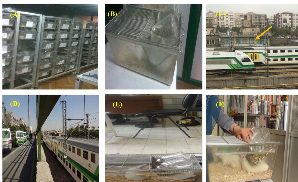
شکل ۱- A-B. محل نگهداری گروه کنترل. C. محل ساختمان اداری رز غربی (اطراف ایستگاه مترو صادقیه. D. خیابان رز غربی. E. گروه تجربی در ساختمان اداری رز غربی. F. گروه تجربی در بازار بزرگ تهران.

Fig. 1. A-B. Control groups. C. West Rose office building location (in the vicinity of Sadeghiyeh metro-station). D. West Rose Street. E. Experimental groups located in West Rose building. F. Experimental groups located in the Tehran Grand Bazaar.