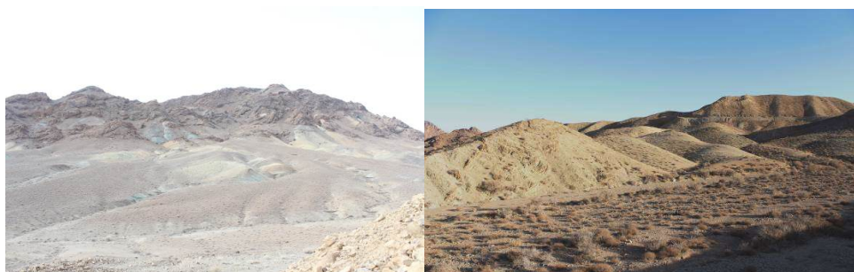
شکل ۱- نماهایی از زیستگاه‌های منطقه شکار ممنوع طالو و شیربند

بر سمی بودن مار گذاشته شد و برای صید آن ابتدا مار را از ناحیه سر مهار و سپس صید انجام شد. پس از مشاهده هر یک از گونه‌ها، یک فرم اطلاعاتی برای آن‌ها تکمیل شد. از جمله اطلاعاتی برای تک تک گونه‌ها ثبت شد، نام گونه (که با استفاده از یک کلید شناسایی معتبر شناسایی انجام شد)، نام محقق، تاریخ مشاهده گونه، ساعت مشاهده، نام جمع‌آوری کننده نمونه، موقعیت جغرافیایی (طول و عرض جغرافیایی)، شرایط جوی، دمای هوا، نوع زیستگاه، نوع پوشش گیاهی، نوع بستر و اطلاعات ریخت‌شناسی و اندازه‌های نمونه ثبت گردید. پس از جمع‌آوری نمونه‌ها و شناسایی و ثبت آن‌ها، تصاویر لازم از هر نمونه با دوربین عکاسی (دوربین ۶۵۰ D Canon و لنز نرمال ۱۸۵۵) تهیه گردید. تعدادی از