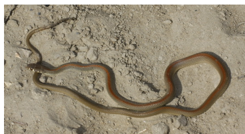
شکل ۵- مار قیطانی.