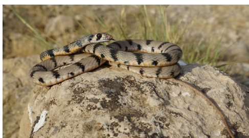
شکل ۴- مار خال‌دار.