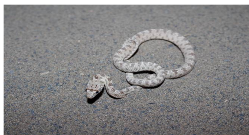
شکل ۶- شترمار.