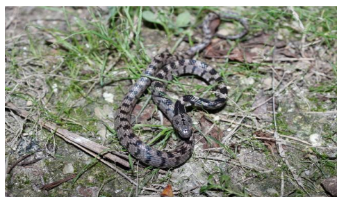
شکل ۳- سوسن مار.