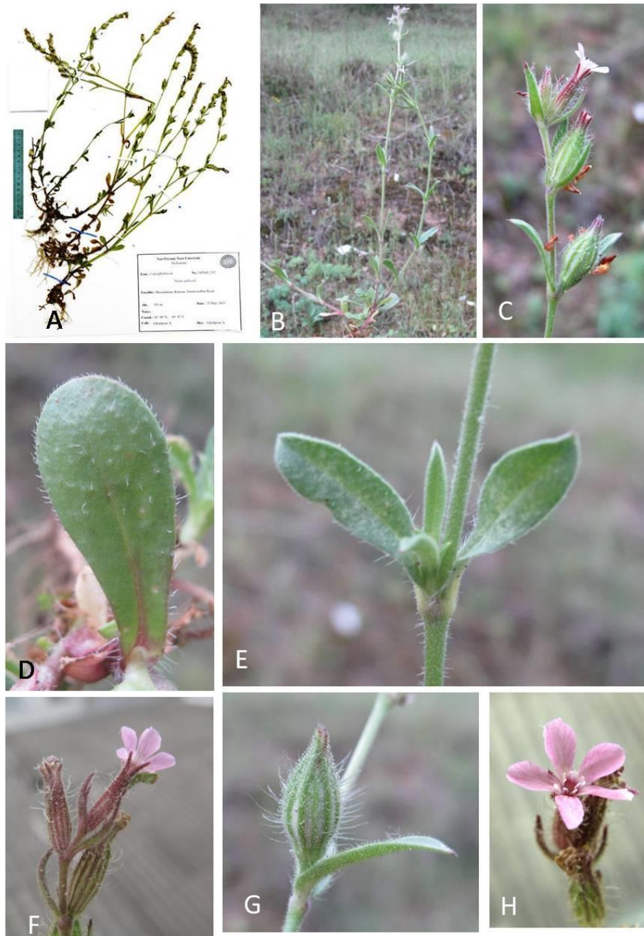
شکل ۲- Silene gallica : A: نمونه هرباریومی SPNH-2292، B: نمای طبیعی گیاه، C: گل آذین، D: برگ قاعده‌ای، E: برگ ساقه‌ای، F:

شکل کاسه در زمان گل، G: شکل کاسه در زمان میوه، H: نمای گل.