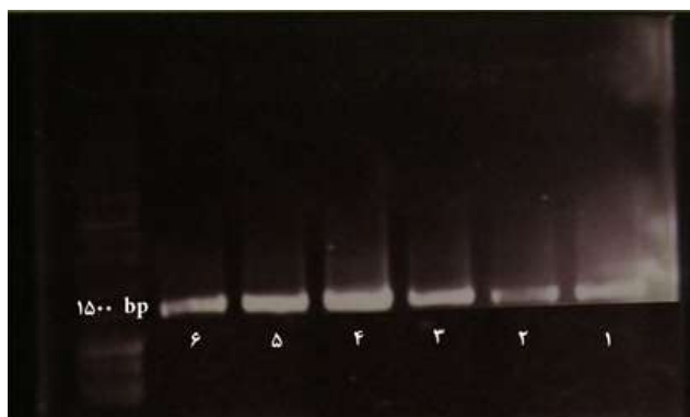
Fig. 1. 2% agarose gel, lane 1 to 6 PCR products of 1413. The temperature increases from right to left.

۱: دما ۵۵°C، محصول PCR مقدار ۱۰ μl، ۲: دما ۵۶/۷°C، محصول PCR مقدار ۱۰ μl، ۳: دما ۵۸/۲°C، محصول PCR مقدار ۱۰ μl، ۴: دما ۶۰°C، محصول PCR مقدار ۱۰ μl، ۵: دما ۶۱/۴°C، محصول PCR مقدار ۱۰ μl، ۶: دما ۶۲/۵°C، محصول PCR مقدار ۱۰ μl، چاهک آخر ۳ μl نشانگر base ۱۰۰ plus