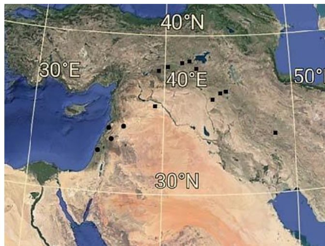
شکل ۳- پراکنش گونه‌های S. melampyroides (■) و S. neurocalycina (●).