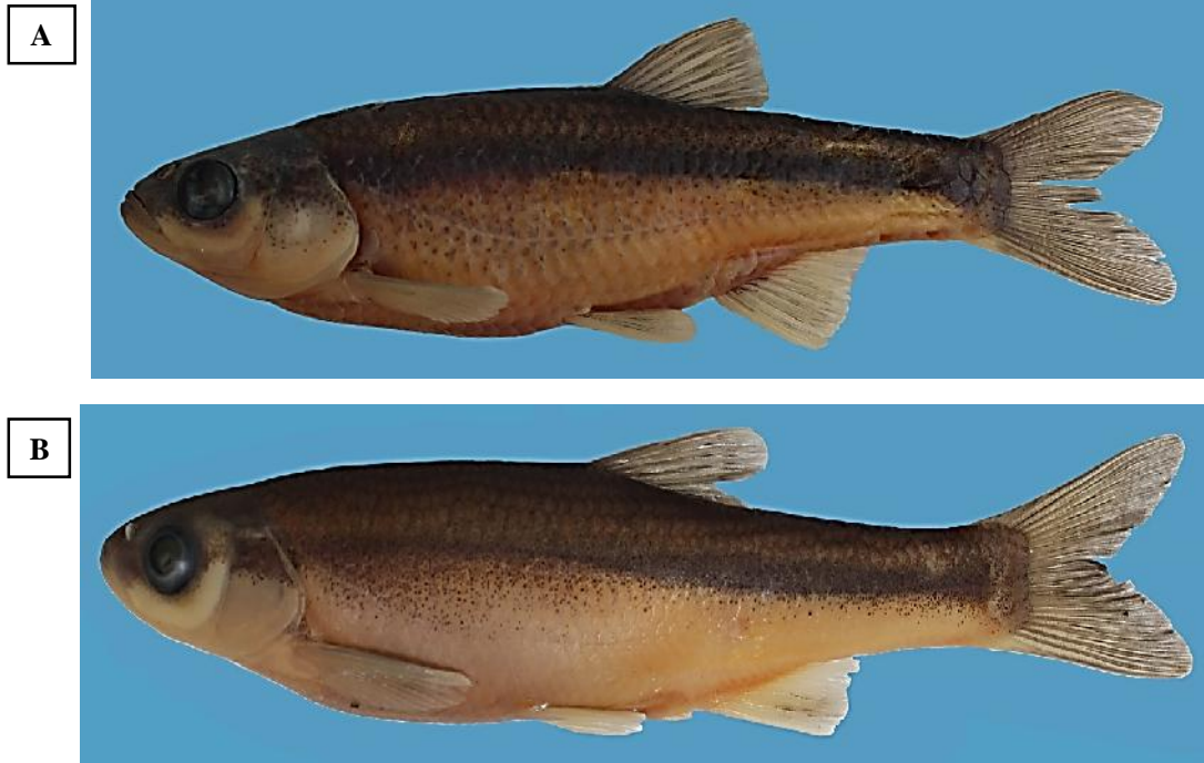
شکل ۱- نمای جانبی دو گونه P. ulanus (A) و A. atropatena (B) صید شده از رودخانه مهابادچای، حوضه دریاچه ارومیه. Figure 1. Lateral view of Petroleuciscus ulanus (A) and Alburnus atropatena (B) collected from the Mahabad-Chi River, Urmia Lake basin.